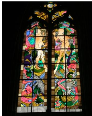
Adam et Eve

La Cathédrale a bien des trésors, et elle est une mosaïque d'architectures du 6 ème au 20 ème siècles.