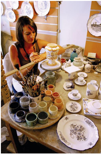
La faïence de Nevers Entre tradition et modernisme